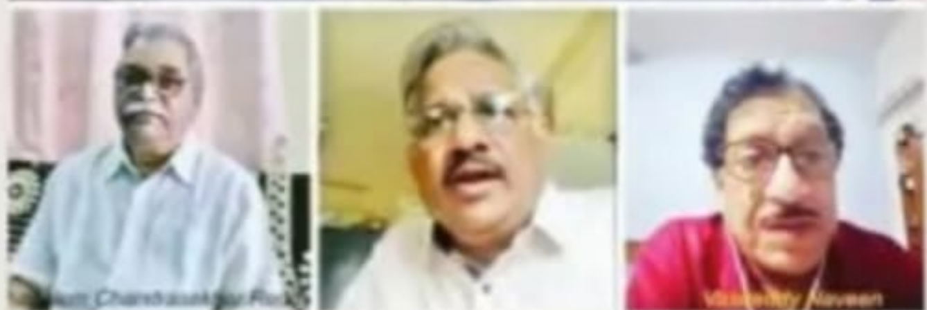
వెబినార్‌లో పాల్గొన్న కవులు, రచయితలు