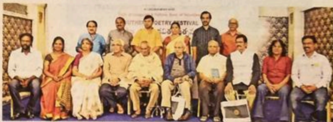
సమైక్యనానికి హాజరైన వివిధ రాష్ట్రాల కవులు

● ఈ సారి ప్రచురణలకు పెద్దపీట వేయాలని నిర్ణయం